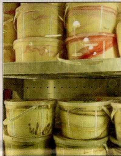
Ein Schlaraffenland für Eis-Liebhaber: 200 verschiedene Eissorten gibt es im Commissary-Supermarkt.

Fülle der Ware – das Flair einer Altstadt hat das EPX auf keinen Fall. „Durch die Gassen bummeln, Kaffee trinken, die historischen Gebäude genießen – damit locken wir die Amerikaner nach Weiden.“