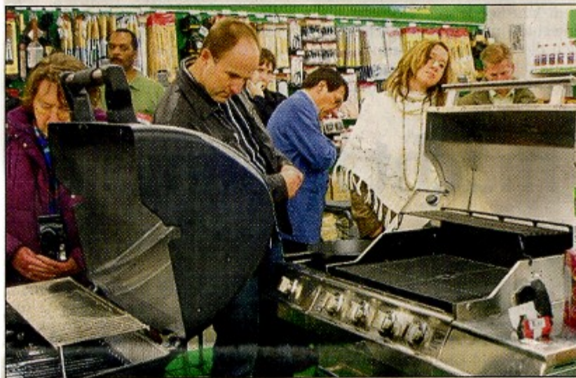
Die „Stars“ im EPX-Markt: Die riesigen, amerikanischen Grills kamen bei den deutschen Gästen von Pro Weiden extrem gut an.

„Typisch amerikanisch“ geht es im „Commissary“-Supermarkt weiter. Mayonnaise in Liter-Packungen, rie-